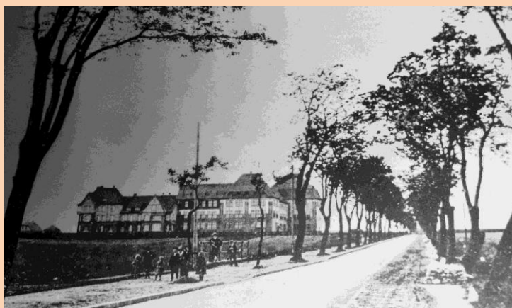
Widok szkoły z 1912

O wybudowaniu budynku szkoły zdecydowało Prowincjonalne Kolegium Szkolne, które miało na celu utworzenie zakładu kształcenia dla nauczycieli. 27 listopada 1909 roku gmach oddano do użytku młodzieży niemieckiej.